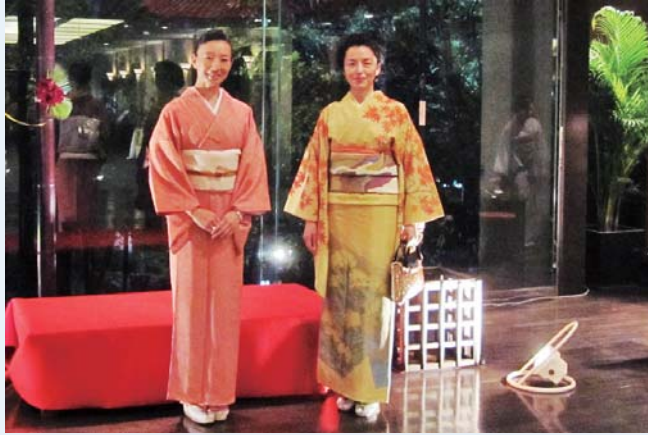
(TC05) Clase para vestirse Kimono