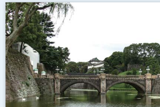
(WT11) Visita al santuario shintoísta de Meiji, Palacio Imperial, Nihombashi

◆ El tour privado sale desde el hotel o desde una estación del tren. Tarifa incluye transporte y entrada al templo. El almuerzo no está incluido.