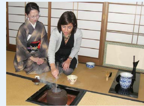
(TC01) Ceremonia del té

Etaapa 4: Les enviamos un billete o una confirmación de registro por correo electrónico después de su pago.