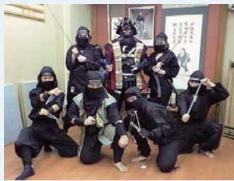
(TB01) Taller de espías ninja