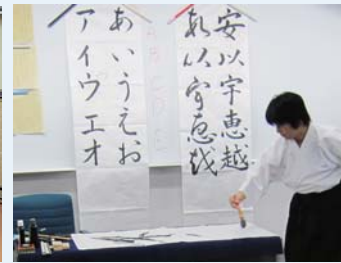
(TC02) Caligrafía japonesa con tinta