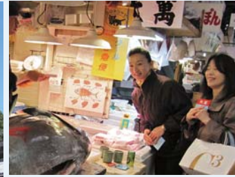
(WT06) Paseo por la lonja de pescado de Tokio