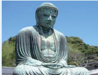
(WK06) Gran buda y templos