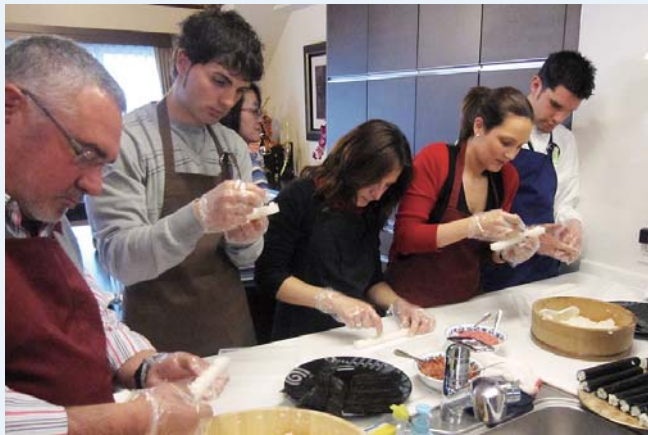
(TK01) Preparación de Sushi y mini-fiesta en una familia japonesa