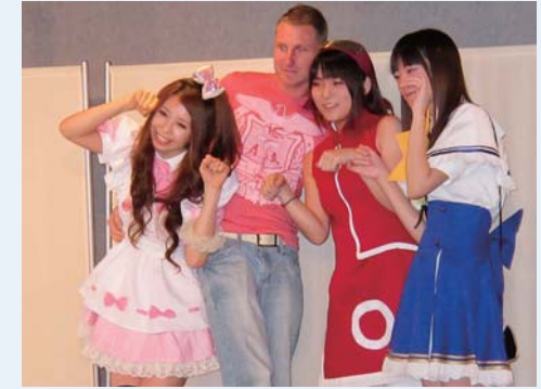
(WT13) Paseo por Akihabara