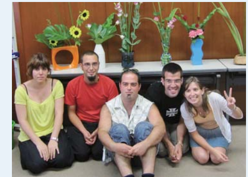
(TC03) Arreglos florales (Ikebana)